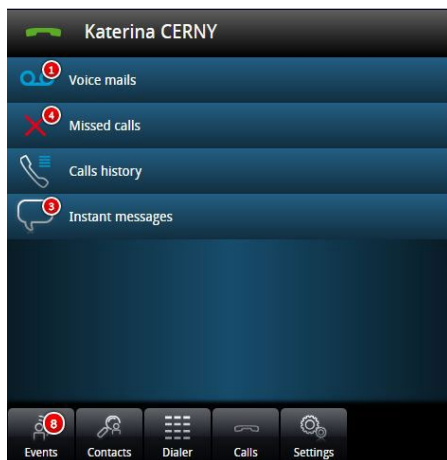
Page d'accueil My IC Web

Les collaborateurs disposent d'une plus grande flexibilité dans leur travail, dès lors qu'ils combinent le terminal le mieux adapté à leur contexte professionnel et des services susceptibles d'optimiser leur efficacité. La mobilité est un autre avantage clé qui permet aux utilisateurs de conserver un lien étroit avec leur entreprise et d'assurer ainsi la permanence de l'activité. L'application Alcatel-Lucent My IC Web est conçue pour les petites et moyennes entreprises (PME). Elle contribue à augmenter la productivité des collaborateurs de manière significative. Basée sur un navigateur, elle leur permet de se connecter au serveur de communication Alcatel-Lucent OXO Connect de leur entreprise et d'accéder, depuis une interface conviviale, à des services de communication.