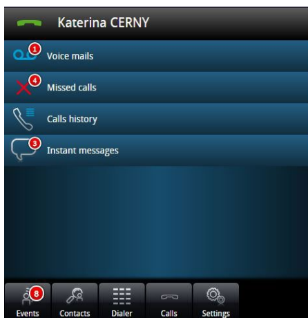
My IC Web - Homepage

Die Mitarbeiter wollen flexibler und integrierter arbeiten können, mit dem für ihren Kontext passenden Gerät und den richtigen Diensten für maximale Effizienz. Eine weitere zentrale Komponente ist Mobilität, die es den Mitarbeitern erlaubt, in engem Kontakt mit ihrem Unternehmen zu bleiben und damit die Kontinuität der Geschäftsprozesse zu gewährleisten. Die Anwendung Alcatel-Lucent My IC Web wurde speziell für kleine und mittelständische Unternehmen (KMU) entwickelt. Diese vollständige, browserbasierte Anwendung, die auf die Alcatel-Lucent OXO Connect zugreift und Kommunikationsdienste über eine benutzerfreundliche Oberfläche bereitstellt, trägt wesentlich dazu bei, die Produktivität der Mitarbeiter zu verbessern.