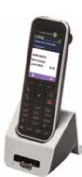
Combiné DECT 8242