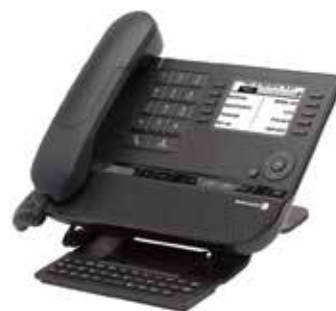
8038 Premium Deskphone

Alcatel-Lucent Enterprise es uno de los principales proveedores de soluciones y servicios de telecomunicaciones para empresas, desde la oficina hasta la nube. Somos una empresa con un largo historial de espíritu innovador y emprendedor que opera en todo el mundo con más de 2700 empleados en más de 100 países y que tiene su oficina central cerca de París, Francia.