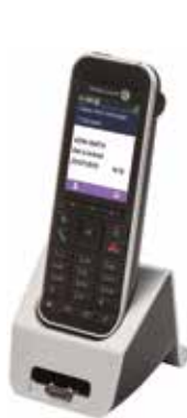
Teléfono 8242 DECT