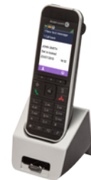
Terminal 8242 DECT

Alcatel-Lucent Enterprise es uno de los principales proveedores de soluciones y servicios de telecomunicaciones para empresas, desde la oficina hasta la nube. Somos una empresa con un largo historial de espíritu innovador y emprendedor que opera en todo el mundo con más de 2700 empleados en más de 100 países y que tiene su oficina central cerca de París, Francia.