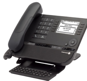
8039 Premium DeskPhone