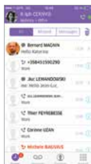
OpenTouch Conversation pour iPhone