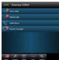
My IC Web pour Office