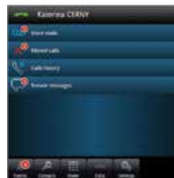
My IC Web para Office