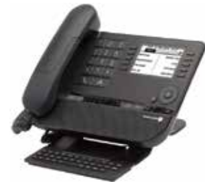
8038 Premium Deskphone

Alcatel-Lucent Enterprise es uno de los principales proveedores de soluciones y servicios de telecomunicaciones para empresas, desde la oficina hasta la nube. Somos una empresa con un largo historial de espíritu innovador y emprendedor que opera en todo el mundo con más de 2700 empleados en más de 100 países y que tiene su oficina central cerca de París, Francia.