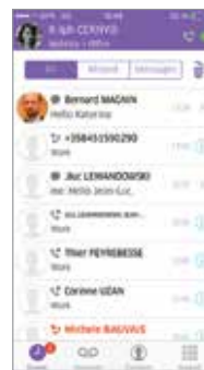
OpenTouch Conversation para iPhone