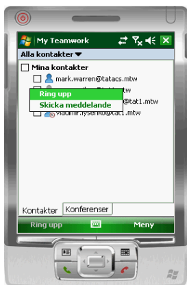
Bild 6 Kontaktlista

Obs! Om nätverksanslutningen avbryts, återupprättas den igen när nätverket återställs.