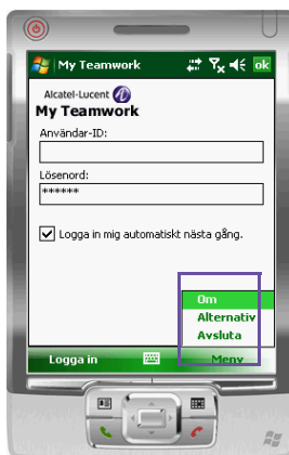
Bild 4 Meny