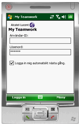
Bild 3 Inloggningskärmen för OmniTouch 8660 My Teamwork