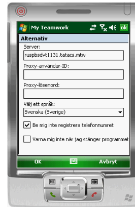
Bild 5 Dialogrutan Alternativ