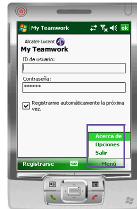
Figura 4 Menú

Aparecerá el cuadro de diálogo Opciones .