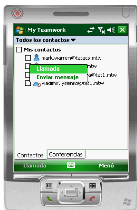
Figura 6 Lista de contactos

Nota: Si pierde el acceso a la red, se volverá a conectar automáticamente cuando se restaure la conexión a la red.