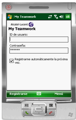
Figura 3 Pantalla de inicio de sesión de OmniTouch 8660 My Teamwork

Aparecer la pantalla de inicio de sesión de My Teamwork.