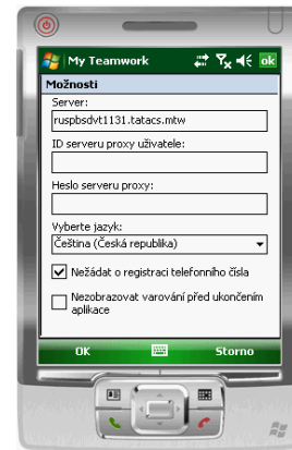
Obr. 5 Dialogové okno Možnosti