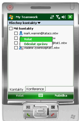
Obr. 6 Seznam kontaktů

Poznámka: Pokud dojde k přerušení připojení k síti, budete automaticky znovu připojeni, když bude síťové připojení obnoveno.