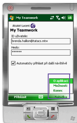
Obr. 4 Nabídka