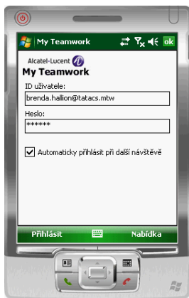
Obr. 3 Přihlašovací obrazovka aplikace OmniTouch 8660 My Teamwork