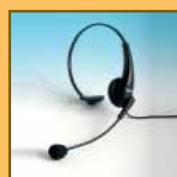
Z jedną słuchawką