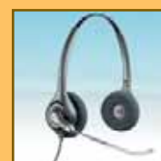
Z dwiema słuchawkami