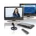
LifeSize Express 200