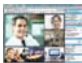
OmniTouch 8660 My Teamwork Conferencing and Collaboration