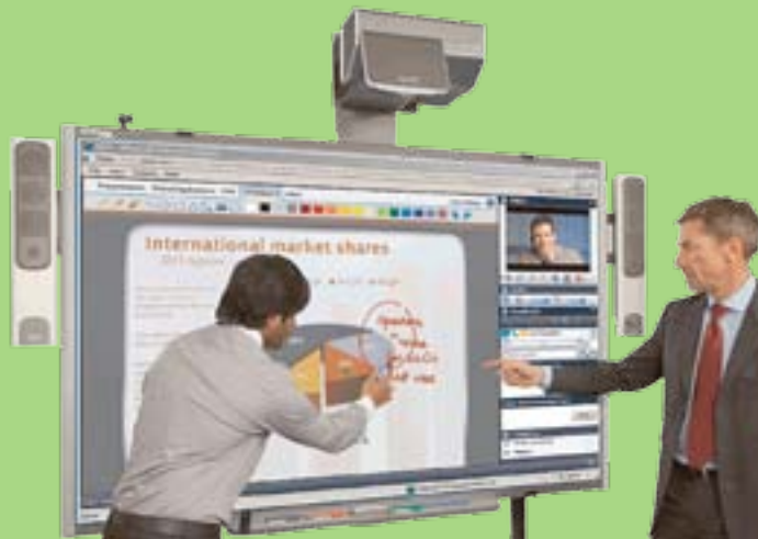
Alcatel-Lucent Interactive Whiteboard Solution

Il virtuale non è mai stato così reale con la lavagna interattiva Alcatel-Lucent.