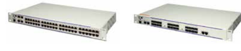
OmniSwitch™ 6850E48X OmniSwitch™ 6850EU24X