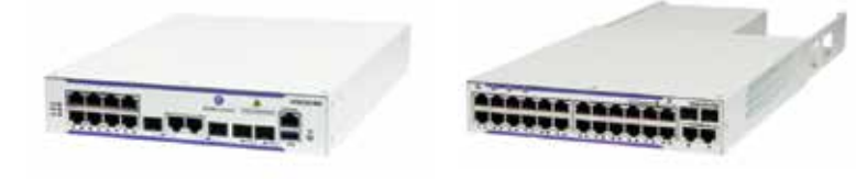
OmniSwitch™ 6250-8M OmniSwitch™ 6250-24