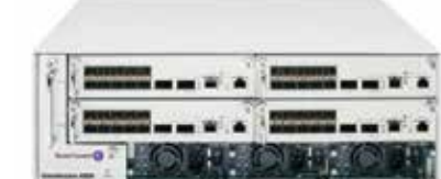
OmniAccess™ WLAN 6000