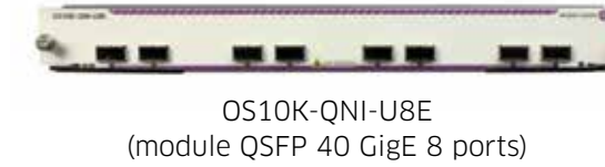
OS10K-QNI-U8E (module QSFP 40 GigE 8 ports)