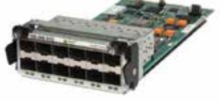
OS-XNI-U12 (module + SFP 10 GigE 12 ports)