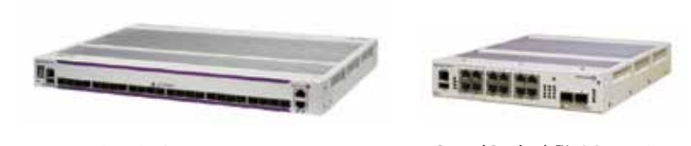
OmniSwitch™ 6855-U24X OmniSwitch™ 6855-14