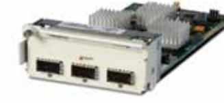
OS-XNI-Q3 (module QSFP 40 GigE 3 ports)