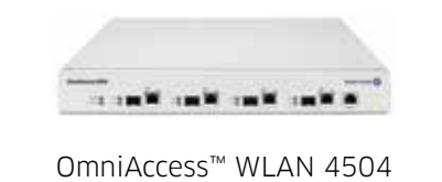
OmniAccess™ WLAN 4504