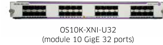
OS10K-XNI-U32 (module 10 GigE 32 ports)