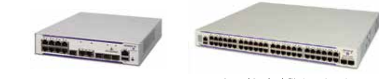
OmniSwitch™ 6450-10 OmniSwitch™ 6450-48