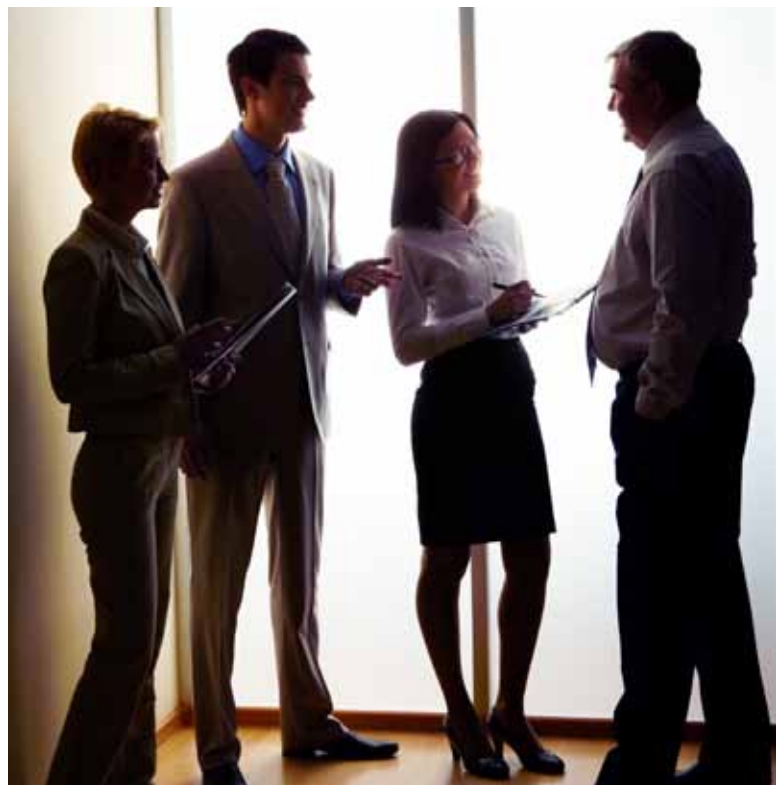
Figure 1. Les différentes versions d'OpenTouch répondent aux besoins des entreprises comme des fournisseurs de services