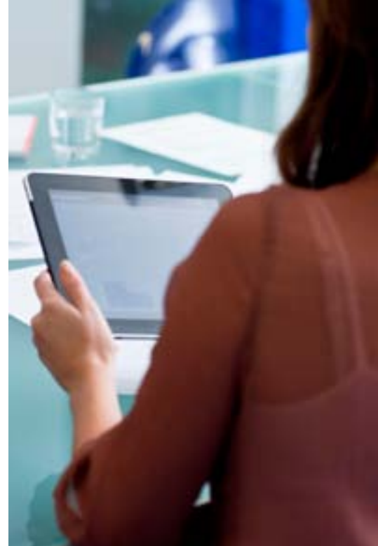
Figure 1. Portefólio da suite Alcatel-Lucent OpenTouch para PME's

As aplicações e as licenças de software para os servidores de comunicações bem como a infraestrutura de rede das PME's, é modular a todos os níveis e cumprem os requisitos exatos dos clientes. Poderá adquirir o portefólio com garantia de hardware e uma variedade de serviços, que evoluem de um simples contrato de manutenção a um sistema completo com novas aplicações e tecnologias. A Suite Alcatel-Lucent OpenTouch para PME's está preparada para o futuro, baseada num servidor de comunicações potente e flexível, o OmniPC X™ Office Rich Communication Edition (RCE) , utilizando protocolos padrão e oferecendo uma série de potentes funcionalidades.