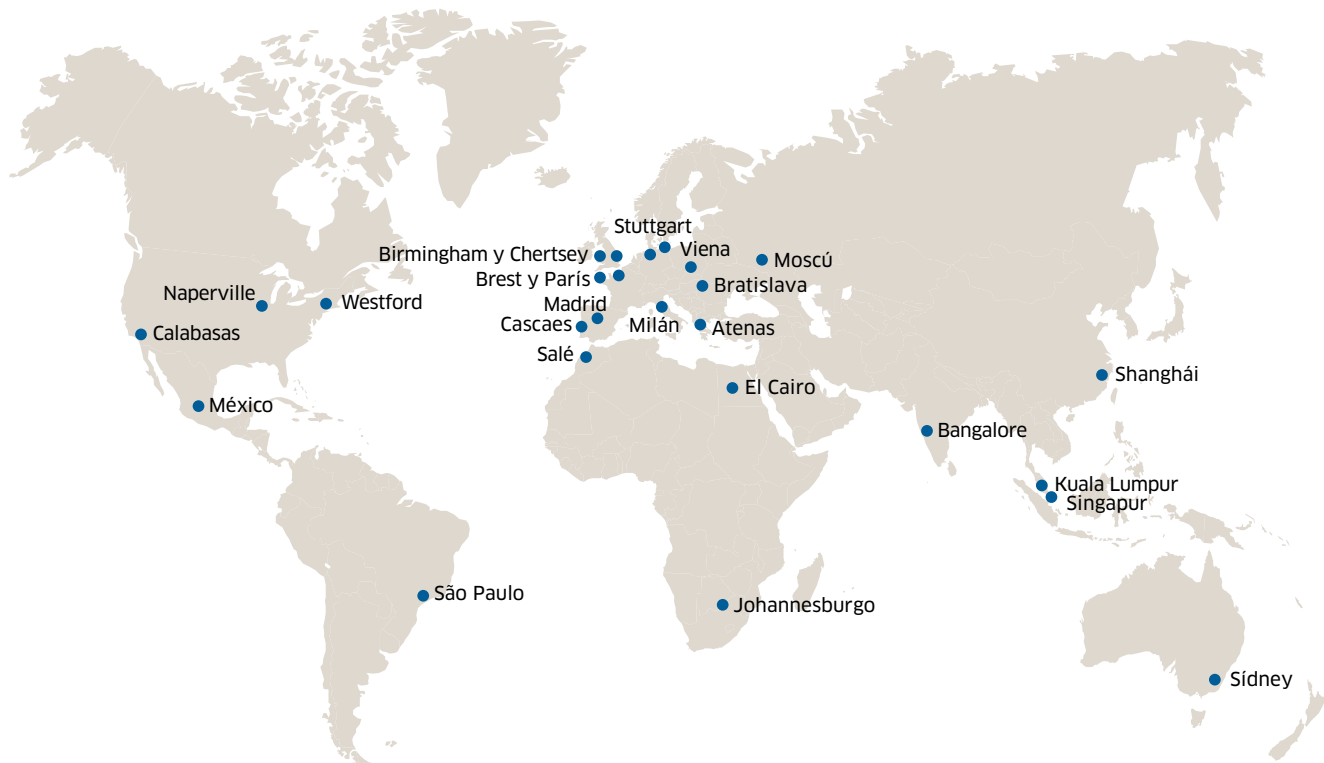
Figura 2. Veinticuatro Centros de formación: tiene uno cerca