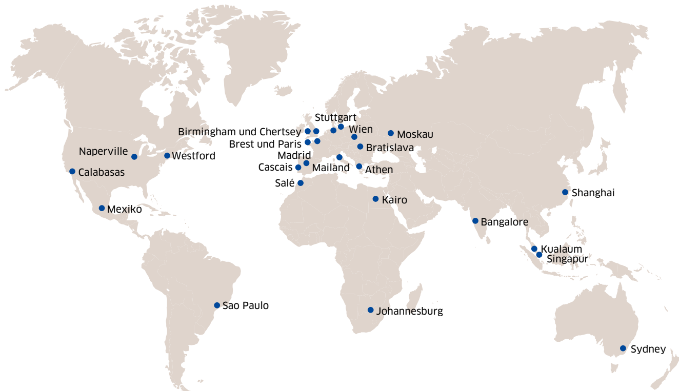
Abb. 2: 24 Schulungszentren: Bestimmt ist eines auch in Ihrer Nähe...