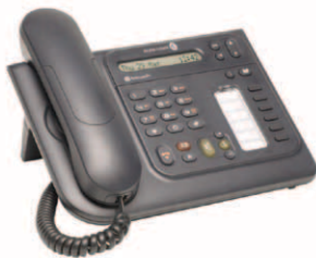
Téléphones Alcatel-Lucent IP Touch 4008EE/4018EE

Les téléphones Alcatel-Lucent IP Touch™ 4008/4018 Extended Edition (EE) sont des postes fixes économiques d'entrée de gamme offrant des fonctions de téléphonie classiques ainsi qu'une connectivité IP intégrée.