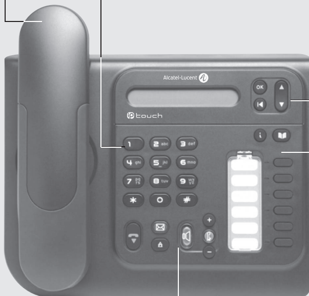
Alcatel-Lucent IP Touch 4018 Phone